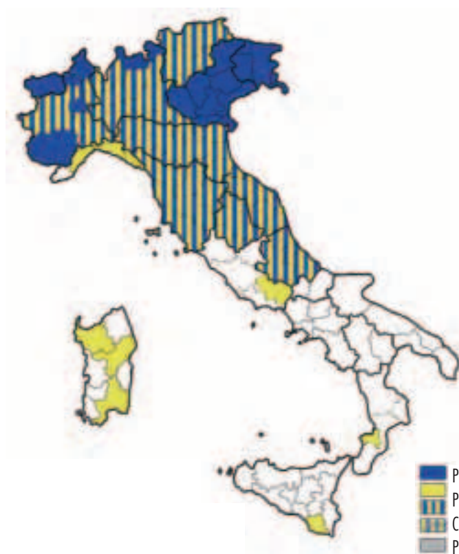
Fig. 2.2 - Compresenza Piani e Quadri Territoriali e Regionali/Piani Territoriali Provinciali